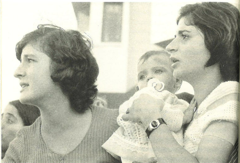
ΑΝΑΜΕΝΟΝΤΑΣ ΜΕ ΑΓΩΝΙΑ ΤΗΝ ΕΠΙΣΤΡΟΦΗ ΤΩΝ ΑΙΧΜΑΛΩΤΩΝ.

από την Τουρκία η επιστροφή των λειψάνων τους. Και μόνο για όσους υπάρχουν μαρτυρίες ή αξιόπιστες πληροφορίες ότι συνελήφθησαν από τους Τούρκους ή ότι χάθηκαν τα ίχνη τους στις περιοχές που καταλήφθηκαν από τον τουρκικό στρατό έπρεπε να διεκδικηθεί η επιστροφή τους, ζωντανών ή νεκρών.